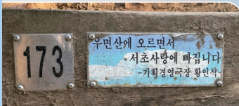
우면산에 기증한 계단목처럼 서초를 향한 마음은 늘 한결같습니다